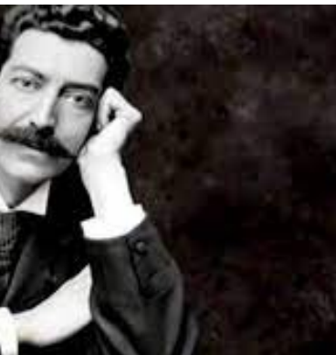
Aurélio da Paz dos Reis (1862-1931), o primeiro cineasta português